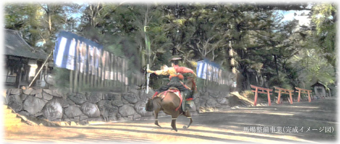
馬場整備事業(完成イメージ図)